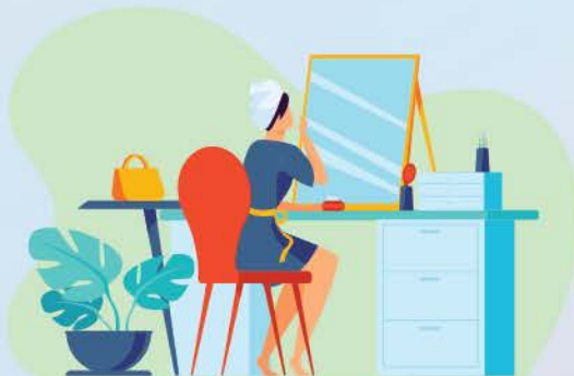
逆齡及養顏需求者